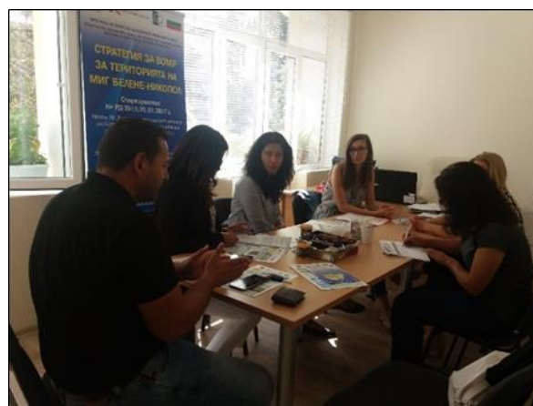
Работна среща с МИГ Белене-Никопол

В периода 27.09.2018 г. – 30.09.2018 г. за екипа на МИГ Бяла Слатина и членове на КВО бе организирано 4-дневно обучение в Сицилия, Италия с цел обмен на добри практики и обучение за подобряване на административния капацитет чрез организиране на срещи с МИГ Натиблей, посещения и беседи за прилагането на ВОМР, посещения на обекти, реализирали проекти към МИГ и опознаване принципите на действие в мрежа, включваща всички икономически субекти на територията на МИГ-а.