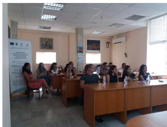
Семинар в гр. Бяла Слатина

На 03.09.2018 г. и 04.09.2018 г., както и на 25.09.2018 г. и 26.09.2018 г. в НЧ „Развитие - 1892“ гр. Бяла Слатина се организираха и проведоха 2 бр. двудневни обучения на местни лидери, уязвими групи и застрашени от бедност целеви групи. В обученията бяха включени теми, свързани с ролята и значението на подхода WOMP, запознаване с мерки 4.1 и 4.2 от СВOMP на МИГ Бяла Слатина, създаване на бизнес идея и бизнес план, както и конкретни