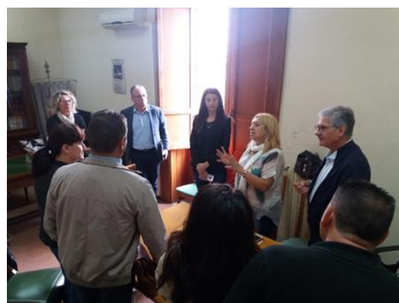
С МИГ Натиблей, Сицилия, Италия

В периода 27.09.2018 г. – 30.09.2018 г. за екипа на МИГ Бяла Слатина и членове на КВО бе организирано 4-дневно обучение в Сицилия, Италия с цел обмен на добри практики и обучение за подобряване на административния капацитет чрез организиране на срещи с МИГ Натиблей, посещения и беседи за прилагането на ВОМР, посещения на обекти, реализирали проекти към МИГ и опознаване принципите на действие в мрежа, включваща всички икономически субекти на територията на МИГ-а.