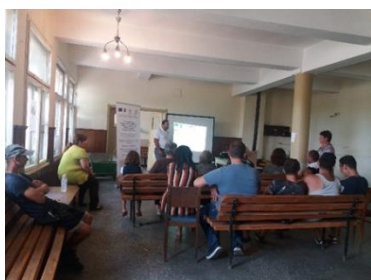
Еднодневна среща в с. Враняк

общо 56 души които получиха и възможност да зададат доизясняващи темите въпроси, както и да получат компетентни отговори от страна на екипа на Сдружение „МИГ Бяла Слатина“.