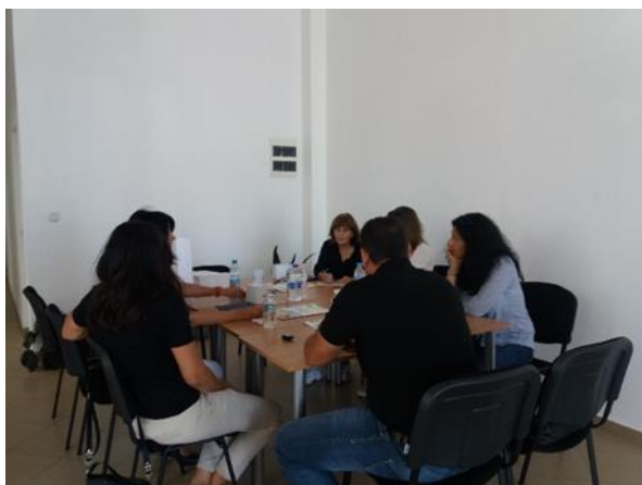
Работна среща с МИГ Ябланица-Правец