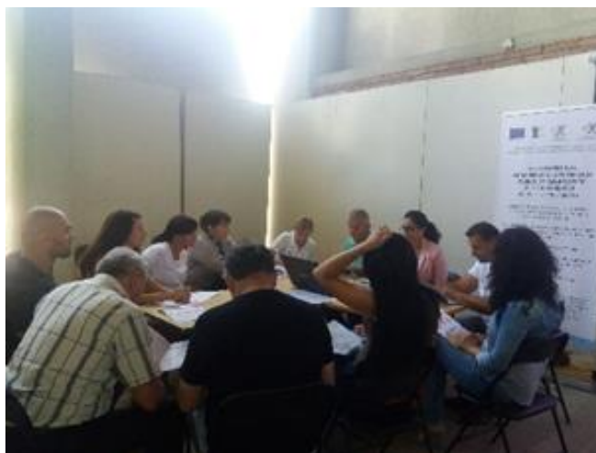
Двудневно обучение на екипа на МИГ и членове на КВО

В периода 10.09.2018 г. – 11.09.2018 г. се проведе двудневно обучение на екипа на МИГ Бяла Слатина и членове на Колективния върховен орган /КВО/ по процедурите за подбор и оценка на проекти. Темите на обучението бяха свързани с изискванията при подготовката на Условия за кандидатстване и образци на документи, запознаване с правилата за държавни помощи, критерии за допустимост и процедура за подбор на проекти, оценка на проектни предложения – техническа и финансова и работа в ИСУН 2020 – създаване на процедура за кандидатстване, подаване на проектно предложение и създаване на оценителна комисия.