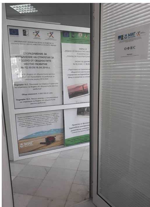
Офис МИГ в гр. Бяла Слатина

За управление и прилагане на Стратегията за ВОМР, МИГ-Бяла Слатина разполага с екип от 4-ма служители – Изпълнителен директор, Експерт по прилагане на СВОМР, Технически асистент и Счетоводител. Основните задължения на МИГ за изпълнение и прилагане на Стратегията включват: