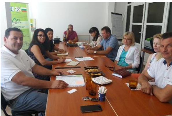
Работна среща с МИГ Троян-Априлци-Угърчин