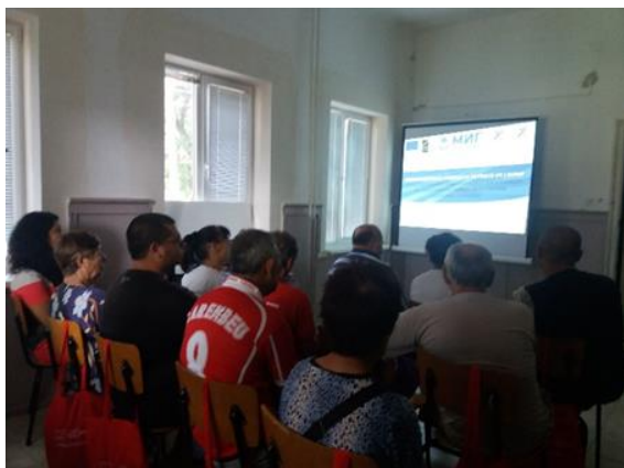
Семинар в с. Попица

подкрепа за всички видове земеделски и неземеделски икономически дейности. Целта на събитията бе участниците да заявят пред екипа на МИГ Бяла Слатина своите проектни намерения и степента на готовност, да получат актуална и полезна информация за периодите и условията за прием, както и конкретни указания за подготовка на проектните предложения. В организирания семинари взеха участие общо 61 души.