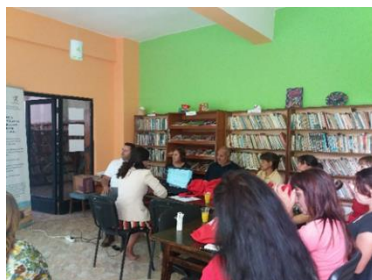
Еднодневна среща в с. Габаре